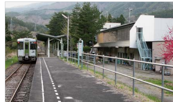
かつての龍泉洞の最寄駅、岩泉駅。1日3回しか列車が姿を現さない全国屈指の過疎路線の終点でしたが、2014年に廃止されました。

時間余りで盛岡へ戻ることができます。往復ともこのバスを利用することも可能ですが、もし時間が許せば津波による被害から復旧した三陸鉄道を使って、復興しつつある岩手県沿岸部の町を片道だけでも訪れていただければと思います。