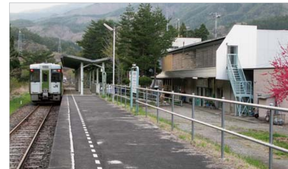
かつての龍泉洞の最寄駅、岩泉駅。1日3回しか列車が姿を現さない全国屈指の過疎路線の終点でしたが、2014年に廃止されました。

時間余りで盛岡へ戻ることができます。往復ともこのバスを利用することも可能ですが、もし時間が許せば津波による被害から復旧した三陸鉄道を使って、復興しつつある岩手県沿岸部の町を片道だけでも訪れていただければと思います。