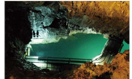
階段の上から見下ろした地底湖。はるか下に青々と光る湖面が見え、まさに絶景です。

これで龍泉洞の見学は終わりですが、帰りも延々とバスと列車を乗り継ぐのは大変だという方には、龍泉洞の前から出ている盛岡行きのJRバスが便利です。このバスに乗車すれば、2