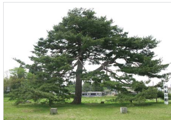
無量光院跡にある「中島の跡」。背景には東北本線の普通電車が何事もなかったかのように走り去ります。

美しい姿を今に伝えています。また、平泉駅にほど近い毛越寺の境内に広がる浄土式庭園のゆったりとした眺めは、心が落ち着き、はるか昔の貴族の文化を今に感じることができます。