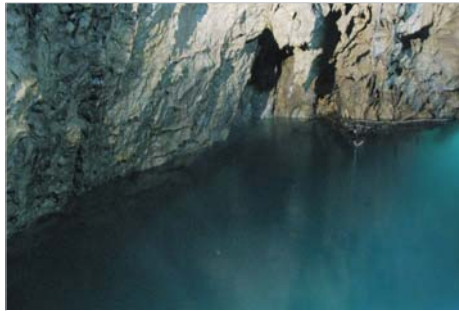
エメラルドに光る地底湖の水面。息を飲む美しさです。

なお、かつては龍泉洞から約3.5km離れた位置にある岩泉駅まで、岩泉線というJR東日本のローカル線がありました。岩泉駅には列車が1日あたり3往復しか発着しないという全国でも屈指の閑散路線で、2010年7月の落石事故以降、復旧されることなく2014年4月に廃止されました。