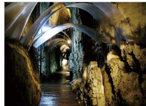
ひんやりとした洞内の様子。気温は年間を通して10℃前後に保たれています。

す。宮古からは2015年10月の本誌39巻4号でご紹介した三陸鉄道北リアス線に乗り換え、岩泉小本（いわいずみおもと）駅で岩泉町民バスへ乗り換え、龍泉洞前のバス停で下車します。これだけでも岩泉からずいぶん遠くへ来た気分で、北海道に次いで全国第2位の面積を誇る岩手県の広さを実感します。