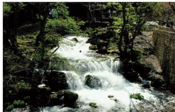
龍泉洞の前を流れる澄み切った溪流。洞内から湧き出す名水百選に選ばれた水です。ぜひ現地でも飲みましょう！

やはり暑くなると、涼しいところに出かけたくくなります。平泉の世界遺産を眺めた後は、一気に太平洋側の三陸へ移動し、岩手県岩泉町にある鍾乳洞、龍泉洞（りゅうせんどう）を訪れてみましょう。岩泉町は岩手県中部の太平洋岸から内陸にかけて広がる町です。この町にある龍泉洞は、澄み切った水をたたえた7つもの地底湖を持つことで有名で、涼しい洞内は夏に訪れるにはもってこいです。