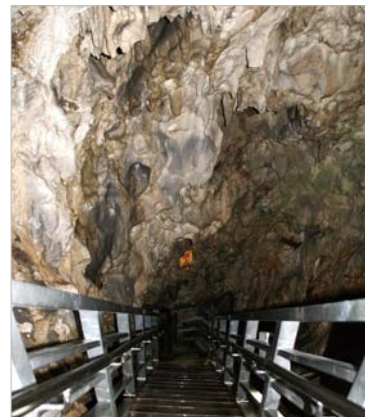
洞内の見学コースの後半は階段が続きます。途中で絶景が待っています。

さあ、それでは洞内へ入っていきましょう。洞内は10度程度とひんやりとしており、上着を羽織っていくことをお勧めします。最初のうちは平らな細い通路が続きます。最初のうちは平らな細い通路が続きますが、ところどころで澄み切った水が流れる様子も見られます。奥へ進むと、第一地