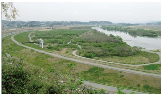
衣川館から眺めた北上川。かつて激しい戦があったことなど想像もつきません。

平泉は、中尊寺がやや駅から離れており徒歩で25分程度を要するものの、歩いて一周できる比較的小さいコンパクトなエリア