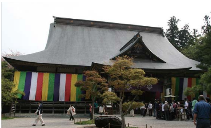
中尊寺の本堂。金色堂が有名ですが、大きなお寺で本堂も多くの参拝者で賑わっています。

まずは岩手県の誇る文化遺産、平泉を訪れましょう。平泉は奥州藤原氏にまつわる様々な史跡を擁し、2011年に世界遺産にも登録された東北を代表する観光地の一つです。