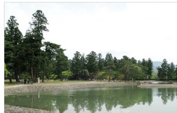
毛越寺の浄土式庭園。ゆったりとした風景に時間の流れを忘れそうです。

色堂は特に有名です。金色堂については数々の観光ガイドブックに掲載されているので多くを語るまでもありませんが、実際にガラスケースに囲まれた金色堂の前に立つと、そのきらびやかな装飾は、900年近くも前に作られたものとは思えない